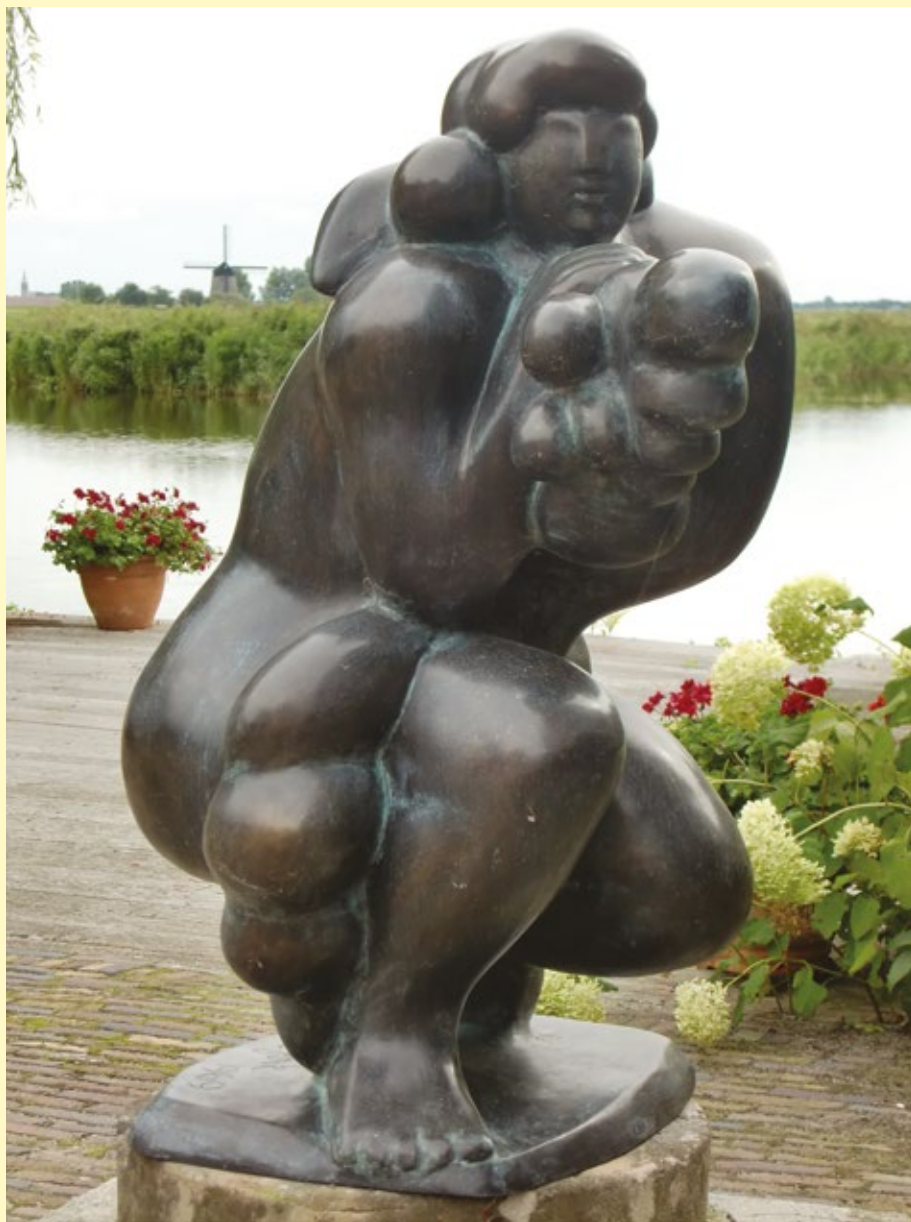
NIC JONK (SCHERMERHORN 1928 - ALKMAAR 1994), LEDA EN DE ZWAAN

Deze bronzen sculptuur van Nic Jonk is verkocht door veilinghuis AAG tijdens een veiling in december 2016. De prijs was € 11.500 (€ 14.313,22 inclusief opgeld, exclusief btw). Hiervoor is een bedrag van € 572,53 aan volgrecht verschuldigd. Het beeld is te bewonderen bij het Museum en beeldentuin Nic Jonk in Grootshermer.