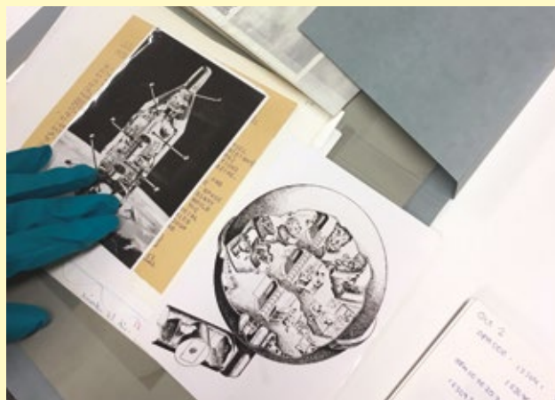
SPAARNESTAD PHOTO ARCHIVE 2.0: (RETRO) ETHICS