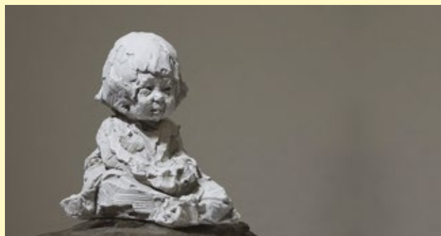
MOONIQ PRIEM WON DE NEDERLANDSE PORTRETPRIJS 2019 (CATEGORIE 3D) MET DIT BEELDJE: LITTLE ICHIKO